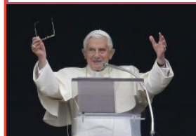
Papa Benedicto XVI, mensaje del Angelus, 27 de Enero de 2013

Colecta Regular de San Juan Epifania Colecta Regular $12,205.14 $641.92 Segunda Colecta America Latina Segunda Colecta America Latina $624.16 $116.27